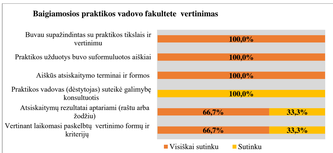
3 pav. Teiginių apie baigiamosios praktikos vadovą fakultete vertinimas

Studentai, vertindami pateiktus kriterijus, apibūdinančius praktikos vadovo fakultete veiklą (3 pav.), pritarė pateiktiems teiginiams. Apibendrinus apklausos duomenis, kolegijos praktikos vadovė fakultete dirbo puikiai.