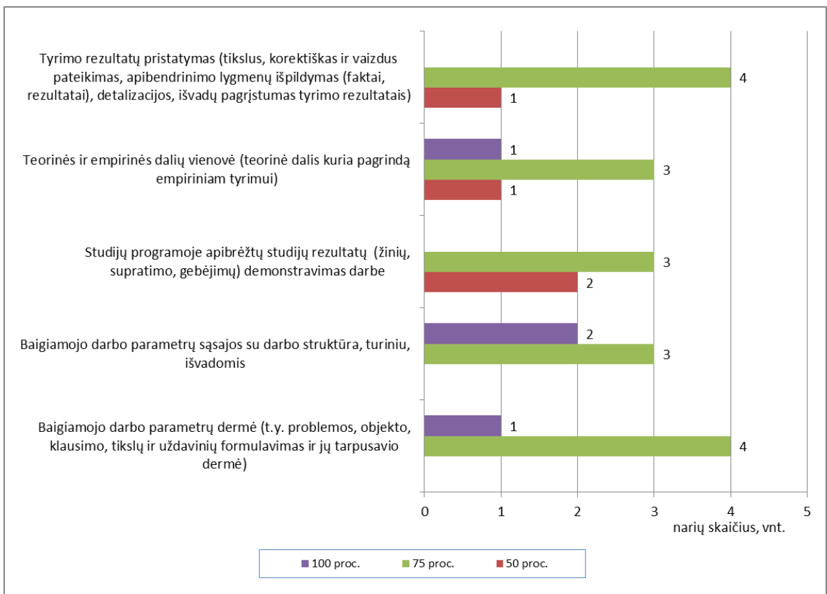
2 pav. Studijų rezultatų demonstravimas baigiamajame darbe